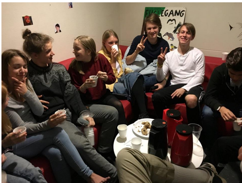
Eleverne på Fuglegangen