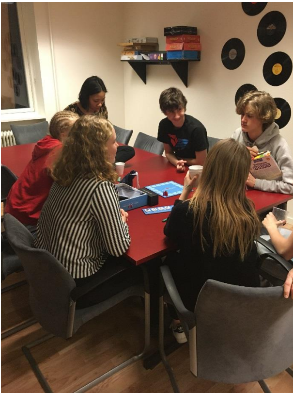
Spil og hygge i Dokken