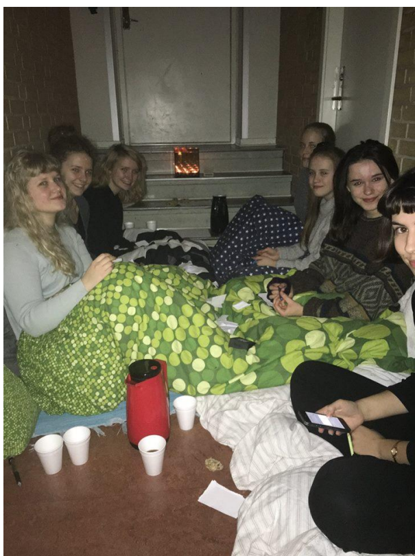
Eleverne på Tonestien (i tiden kaldet Konestien)