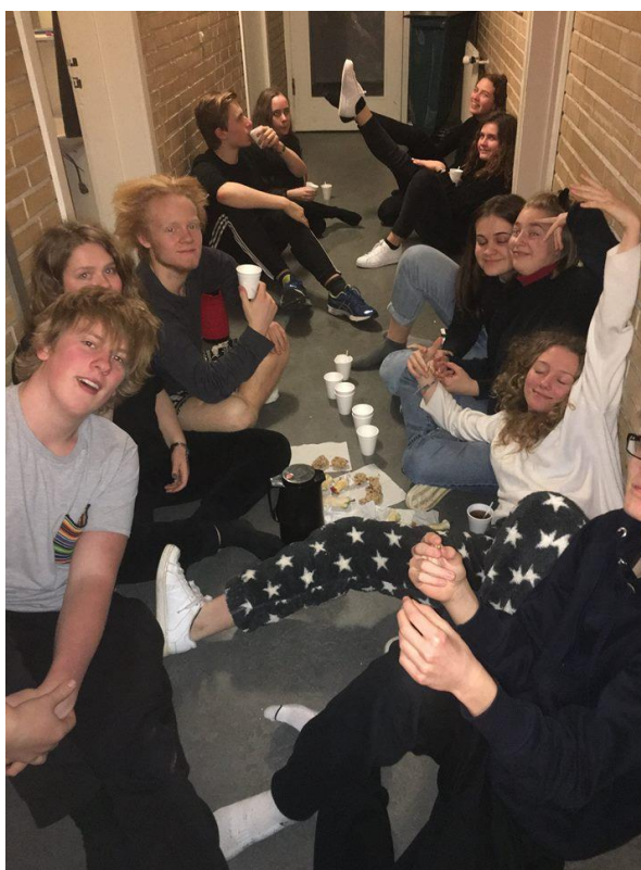
Eleverne på Juvelgang 2